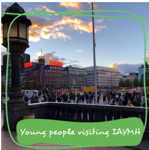
Young people visiting IAYMH

Leon: De IAYMH2022-conferentie in Kopenhagen was een unieke ervaring met mensen uit de hele wereld. Het voelde een beetje alsof de @ease familie niet alleen maar in Nederland bestaat. Vergelijkbare organisaties uit andere contexten hebben hetzelfde doel: het verbeteren van de geestelijke gezondheid onder jongeren. Jongerenparticipatie is een belangrijk onderwerp. Al vanaf het begin probeerde de organisatie van IAYMH2022 zo veel mogelijk jonge mensen te betrekken. Zij kunnen natuurlijk zelf het best aangeven waar zij moeite mee hebben. Zo waren er ook veel jongeren die hun ervaringen in verband met hun eigen geestelijke gezondheid deelden. Naast de wetenschappelijke presentaties over veel verschillende onderwerpen, waren vooral deze ervaringen indrukwekkend en inspirerend.